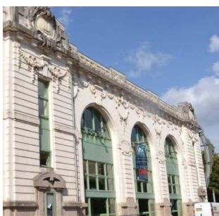
Façade de la salle des Fêtes de l'Union, construite en 1911 à Limoges