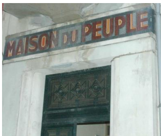
Mosaïque de la façade de la Maison du Peuple Inaugurée le 6 juin 1936, à Limoges

En Limousin, l'histoire sociale contemporaine a une forte dimension et de profondes racines ouvrières. Cette histoire ouvrière fut créatrice et pionnière, notamment en matière de mutualisme, de coopération ou de syndicalisme : création de la CGT, première pharmacie mutualiste de France, plus grande coopérative de France avant la Première Guerre mondiale. Le Limousin est donc une terre de tradition coopérative et associative. Ce riche patrimoine doit être sauvegardé et valorisé dans un projet d'ensemble.