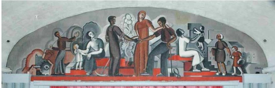
Fresque de Pierre Parot, située au-dessus de la scène dans la salle de spectacles (Maison du Peuple de Limoges)