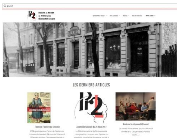
Page d'accueil du site Internet de PR2L

Un projet tuteuré a été réalisé avec des étudiants de afin de rendre le site Internet de PR2L plus attractif et plus ergonomique.