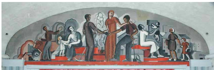
Fresque de Pierre Parot, située au-dessus de la scène dans la salle de spectacles (Maison du Peuple de Limoges)