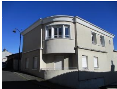
Ancienne succursale de l'Union Syndicale Ouvrière

En 2019 , PR2L a accueilli une étudiante en Licence 3 Valorisation du patrimoine (Université de Limoges) qui a fait un stage de sept semaines à PR2L pour établir des « fiches inventaire » sur le patrimoine de l'Union Syndicale Ouvrière de Saint-Junien . L'étudiante a ensuite effectué une géolocalisation de ce patrimoine sur Google Maps.