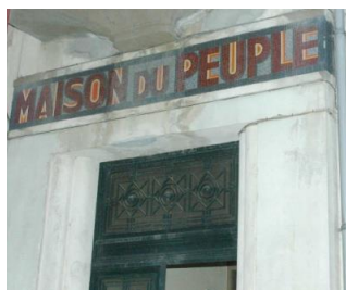
Mosaïque de la façade de la Maison du Peuple Inaugurée le 6 juin 1936, à Limoges

En Limousin, l'histoire sociale contemporaine a une forte dimension et de profondes racines ouvrières. Cette histoire ouvrière fut créatrice et pionnière, notamment en matière de mutualisme, de coopération ou de syndicalisme : création de la CGT, première pharmacie mutualiste de France, plus grande coopérative de France avant la Première Guerre mondiale. Le Limousin est donc une terre de solidarités et de traditions coopératives et associatives. Ce riche patrimoine doit être sauvegardé et valorisé dans un projet d'ensemble.